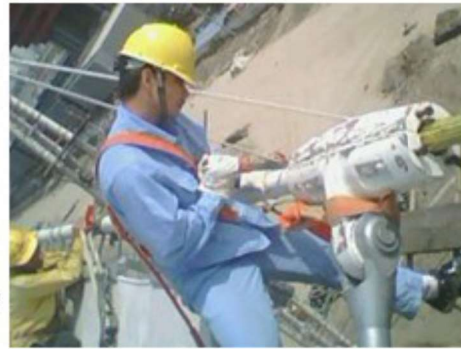
技术人员在现场服务

公司要求每位职工在对客户过程中，将服务对象需要提供的各类材料一次性告知，并发书面通知予以告知，在施工现场的缆索挂设期间公司派技术人员到现场指导安